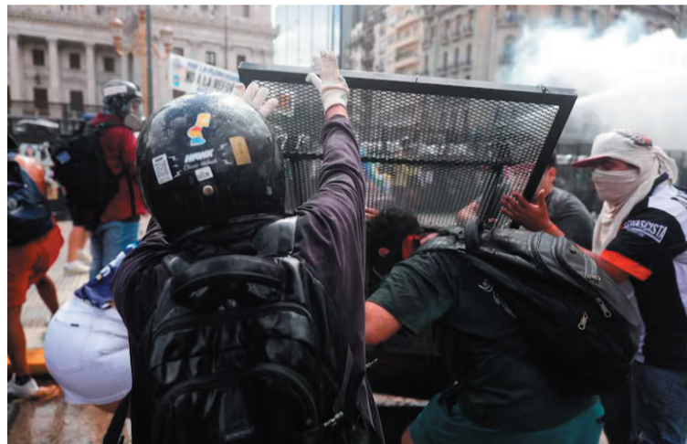
Maratónica. El Senado debatió el proyecto de reforma laboral en una sesión extensa, marcada por negociaciones y cambios sustanciales.

También se incorporó un nuevo esquema de actualización de créditos laborales basado en el Índice de Precios al Consumidor (IPC) más un adicional