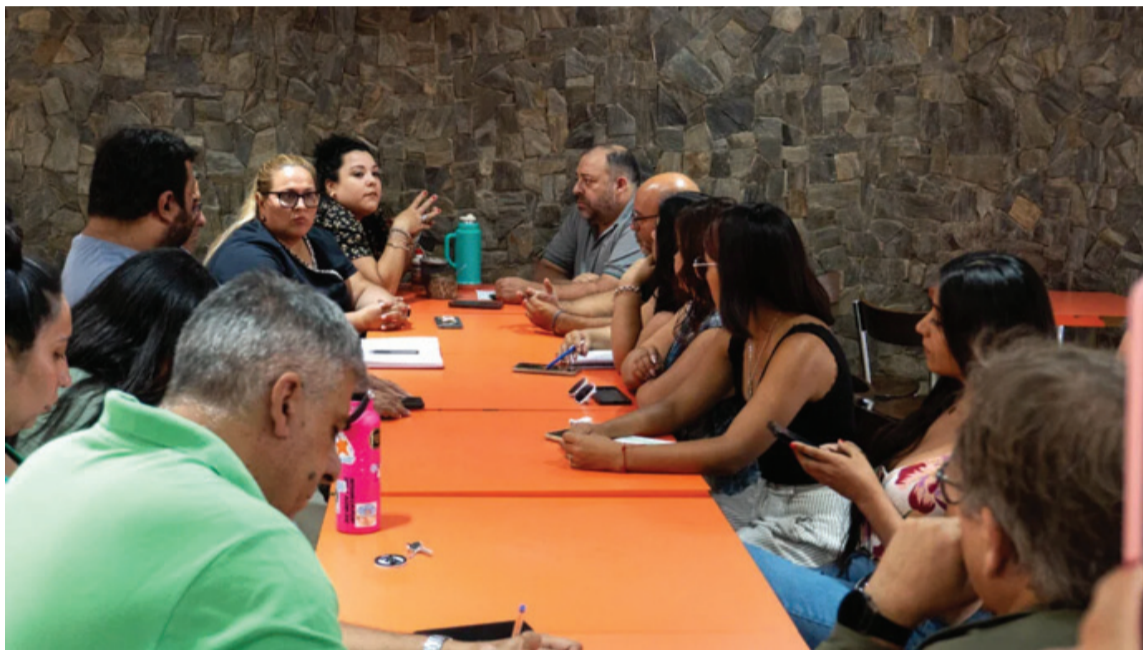
Arrancando. El Frente Gremial de la Universidad de Chilecito mantuvo la primera reunión del año y se adhirió al paro de este miércoles

Con la participación de los gremios Docentes ADUC y ADIUNdeC, el gremio Nodocente ATUNdeC, el Centro de Estudiantes de Biología, Referentes del Frente Estudiantil, y representantes del Estamento de Estudiantes del HCS, se llevó a cabo esta primera reunión del año del Frente Gremial de la Uni-