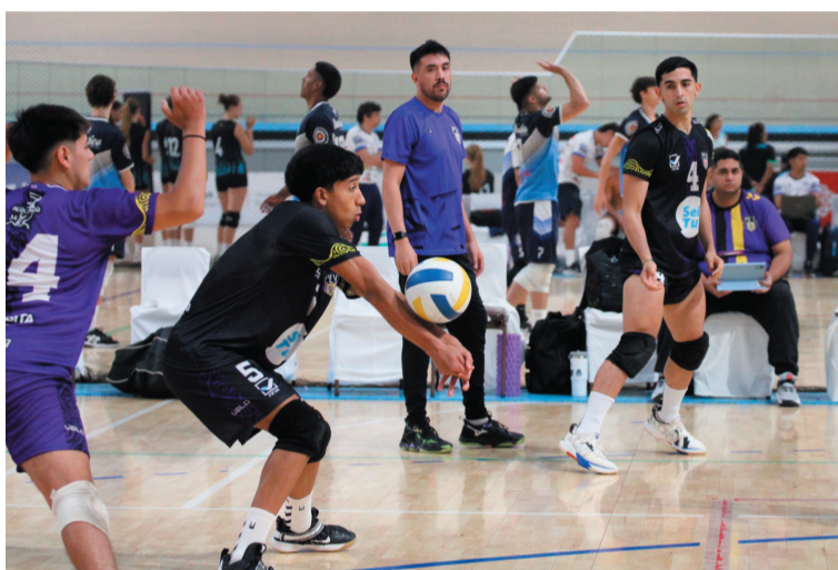
No pudo cerrarlo. Poli Evita tuvo una ventaja de dos sets sobre el equipo sanjuanino, pero terminó perdiendo en el encuentro que cerró el grupo en la Ronda Complementaria del Torneo Federal de Vóleybol 2026.

De esta manera, quedó relegado al segundo puesto de la tabla de posiciones por diferencia